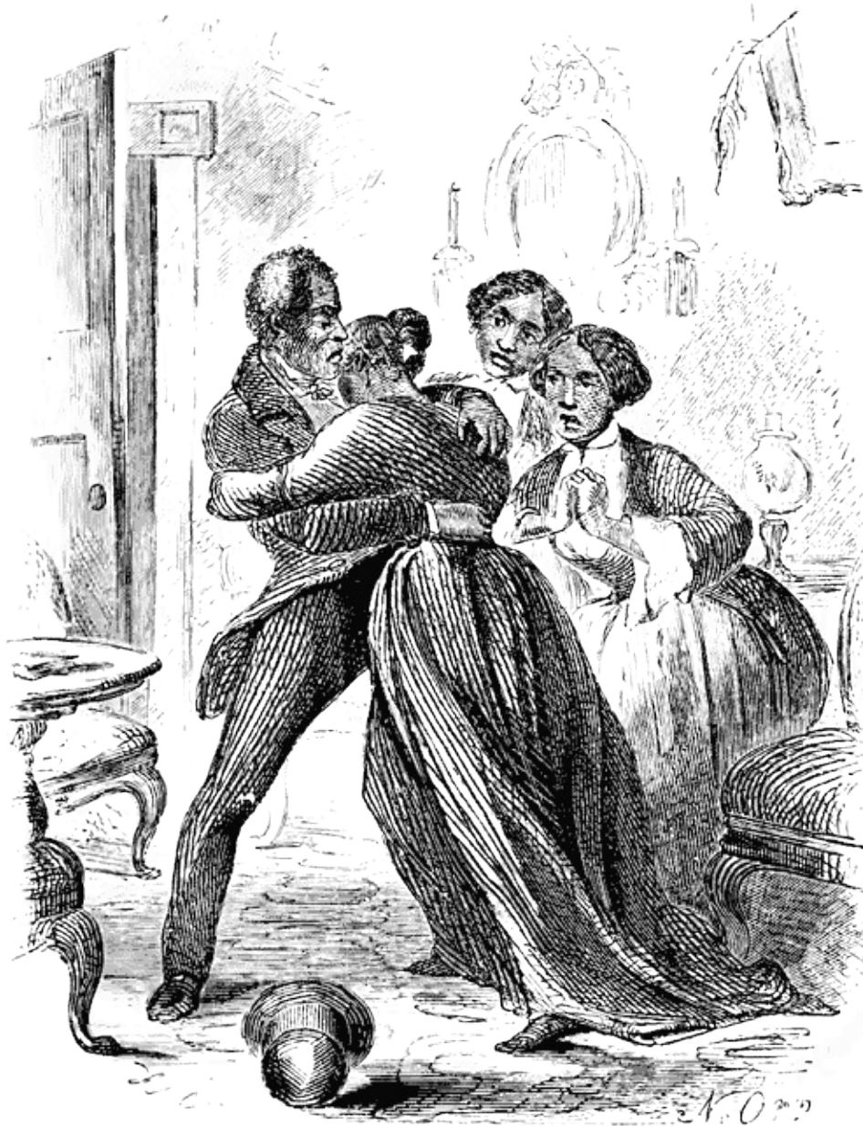
Llegada a casa y primer encuentro con su esposa y sus hijos. Grabado de la primera edición publicada por Miller, Orton & Mulligan en 1853.

Mi relato llega a su fin. No tengo nada que comentar acerca de la esclavitud. Quienes lean este libro podrán formarse su propia opinión sobre esa «peculiar institución». No pretendo saber lo que ocurre en otros estados; lo que sucede en la región del Río Rojo ha quedado verídica y fielmente reflejado en estas páginas. Esto no es ficción ni una exageración. Si en algo he fallado, ha sido en