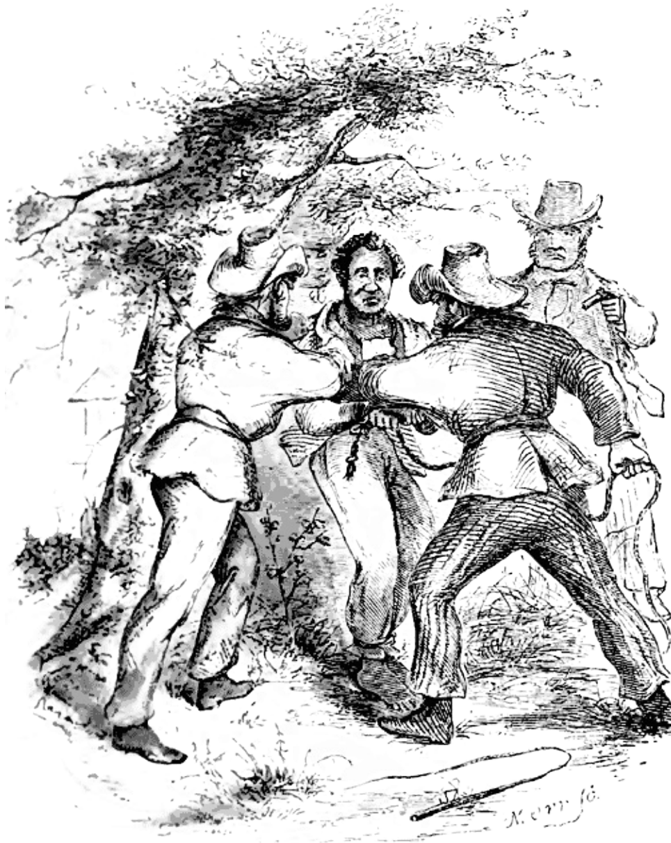
Chapin rescata a Northup de ser colgado. Grabado de la primera edición publicada por Miller, Orton & Mulligan en 1853.

Por fin, cuando me estaban arrastrando hacia el árbol, Chapin, que había desaparecido un momento del porche, salió de la casa y caminó hacia nosotros. Tenía una pistola en cada mano y, según recuerdo, les habló con tono firme y decidido: