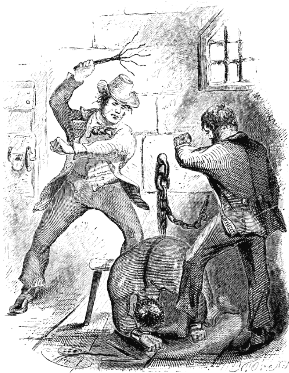
Escena en el corral de esclavos en Washington. Grabado de la primera edición publicada por Miller, Orton & Mulligan en 1853.

Al final guardé silencio ante sus constantes preguntas. No iba a responderle. De hecho, casi no podía ni hablar. Siguió dando latigazos sin descanso a mi pobre cuerpo hasta que pareció que la carne herida se me desgarraba de los huesos con cada golpe. Un hombre con un ápice de piedad en el alma no habría golpeado con tanta crueldad ni siquiera a un perro. Radburn dijo por fin que era