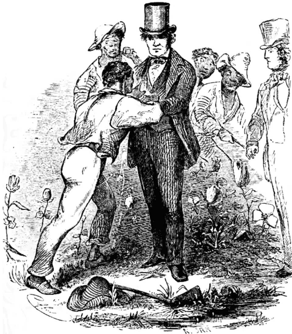
Una escena en el campo de algodón: La entrega de Solomon. Grabado de la primera edición publicada por Miller, Orton & Mulligan en 1853.

Iba a seguir efectuando preguntas, pero lo dejé a un lado, incapaz de retenerme. Así las dos manos de mi antiguo conocido. No podía hablar. No pude contener las lágrimas.