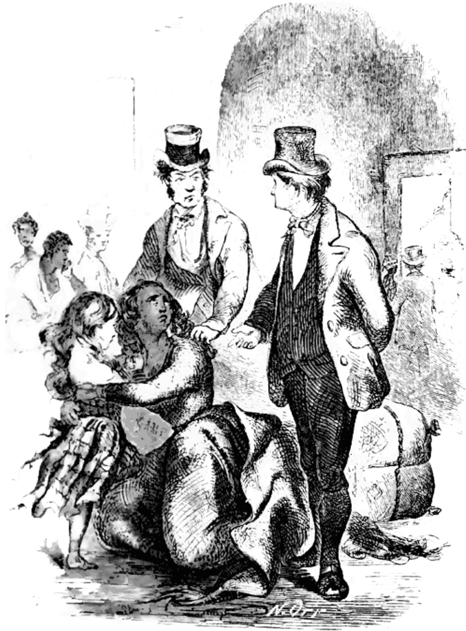
Separación de Eliza y su niña. Grabado de la primera edición publicada por Miller, Orton & Mulligan en 1853.

En cuanto Eliza lo oyó, volvió a angustiarse. En aquellos momentos, la enfermedad y el dolor le habían demacado el rostro, en el que se le marcaban las ojeras. Supondría un alivio para mí pasar por alto la escena siguiente, pero no